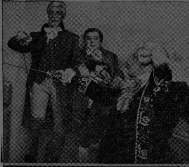
Una escena de la película de capay espada, basada en la novela de Alejandro Dumas, que estamos publicando.

Pepe se lanzó a galope y trató de saltar de su caballo al asiento del cocher, pero éste le golpeó con el látigo hasta hacerle desistir de su empeño. Entre tanto Rolando había alcanzado al postillón que guiba el primer caballo y, con un arriesgado salto, logró derribarlo y se apoderó de las riendas. El coche se tambaleó violentamente, al detenerse de pronto los caballos y los pasajeros comenzaron a sacar la cabeza para ver lo que ocurría. Rolando casi se rió al ver el espanto retratado en sus rostros. "Los Compañeros" rodeaban el carruaje esgrimiendo sus pistolas y gritando como condenados y no tenía nada de particular que el terror petrificara a los viajeros, pero el joven sabía que alguien podía reaccionar y no quería derramar sangre. Rápidamente desmontó y se acercó a donde estaba Pepe, que amenazaba al indefenso cocher con la punta de su espada "por dar de latigazos a un inocente ciudadano".