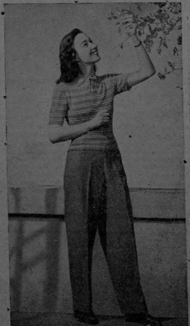
Encantador modelito de slacks, en la próxima temporada verá muy propio para ser usado por jovencitas no muy entradas en car-